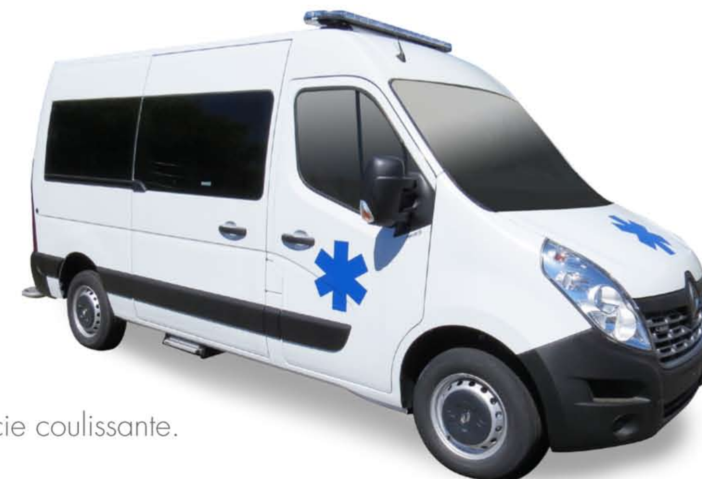
Aménagement en 2 portes latérales