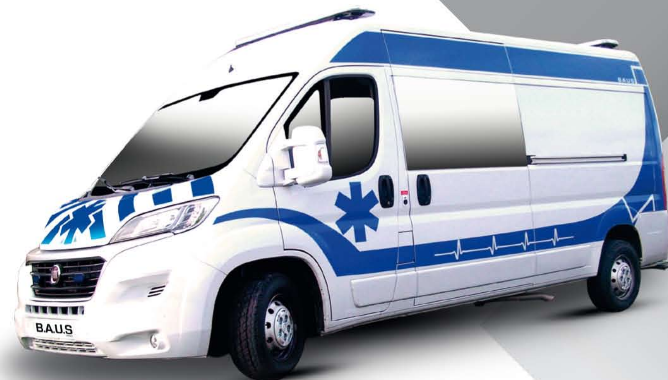
Déco BAUS en option